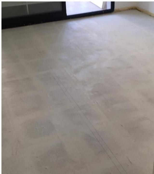
Superficie de trabajo cubierta con 1° Mano de Tarquini