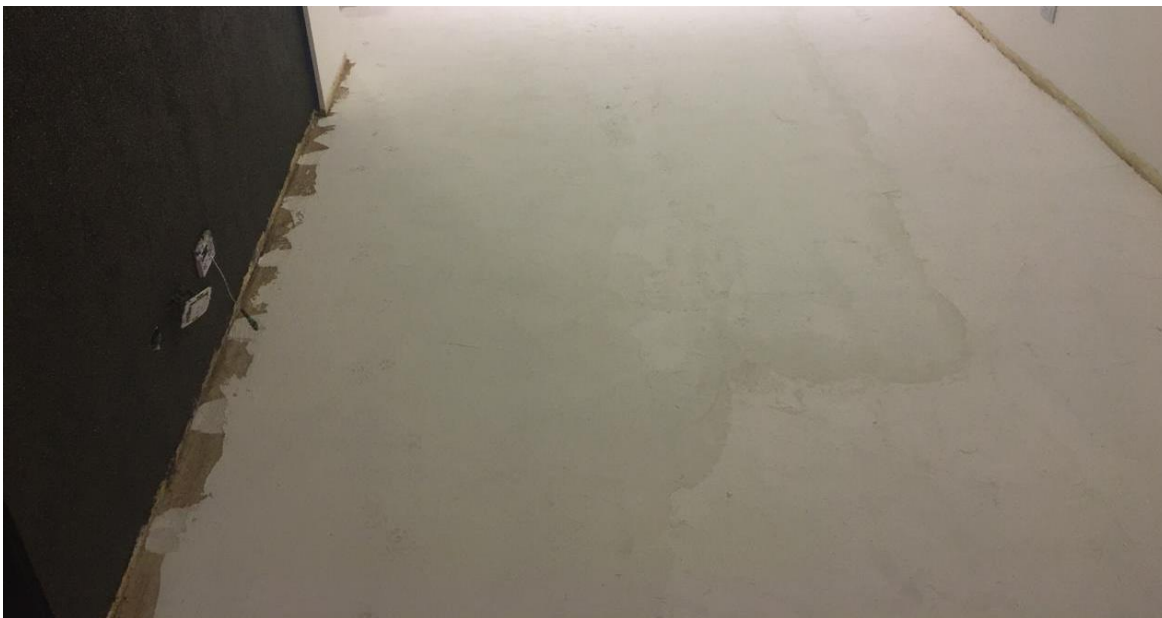
Superficie Cubierta con 2da Mano de Tarquini Flex-Base