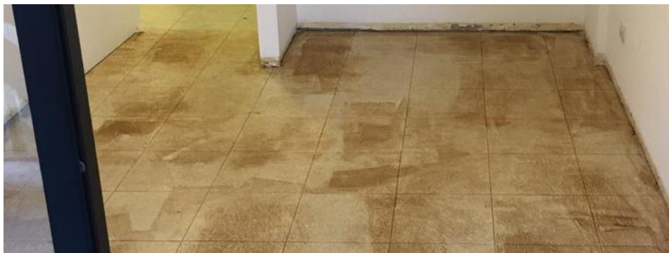
Piso Cerámico con Tarquini Base Mordiente B-51

La forma de saber que el secado de la Base Mordiente es el correcto, es cuando lo tocamos y el material se siente “pegajoso” pero no queda pegado en la mano.